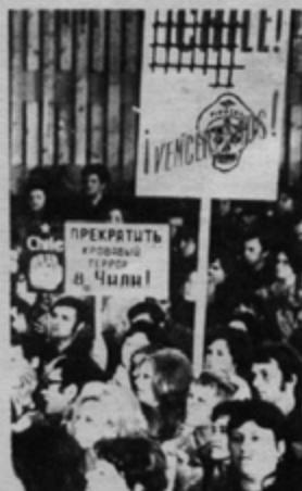
SOVYETLER BİRLİĞİ'NDE ŞİLİ HALKININ DAYANIŞMA TOPLANTILARINDAN BİRİ

Tüm dünya komünistleri, ilerici güçleri Şili halkının yanındadır. Şili'de faşizm şiddetli kanda boğulacaktır.