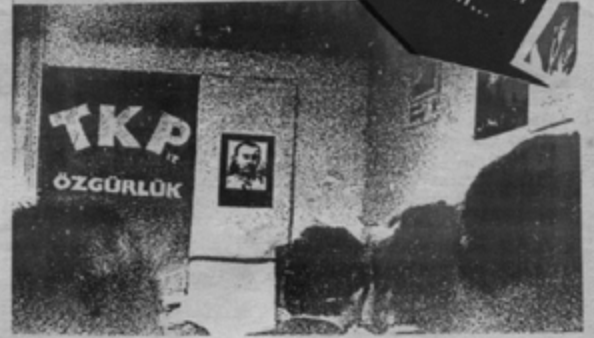
Toplantıdan bir an...